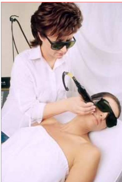
Díky revoluční metodě laserové depilace už není nutné podstupovat bolestivé vytrhávání »knířku«, který zejména u tmavovlásek vypadá opravdu nehezky.

Část zasažených chloupků v kůži může ještě několik dnů přetrvávat, ty postupně vypadnou, můžete je ovšem i odstranit pinzetou. Laserové ošetření je možné provést kdekoliv na těle s výjimkou míst se zánětem kůže a s určitým typem mateřského znaménka ( pigmentovým névem ).