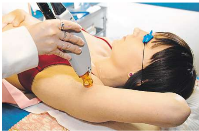
Navždy Pokud jde o chloupek ve fázi růstu, umí tepelná energie laseru zničit růstovou zónu folikulu. Z ní už nic nevyroste.

Chloupky jsou neúprosné, a i když se jich zbavíte holením, za pár dní máte strniště zpátky. Laser to ale umí podstat-