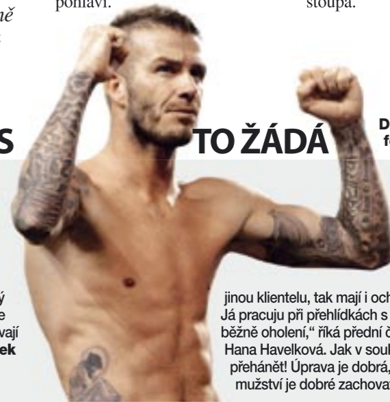
David Beckham, fotbalista a model!

Holení i depilaci těla vnímají jako běžnou mladší muži a pak ti od 35 do 40 let pracující jako manažeři, ředitelé nebo více sportující. České kosmetičky uvádějí, že počet mužů, kteří chtějí na různých místech těla odchlopit, v salonech poslední léta mírně stoupá.