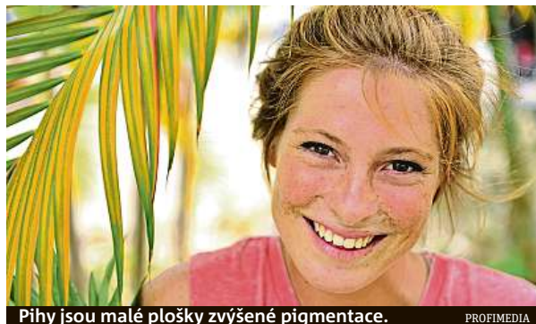
Pihy jsou malé plošky zvýšené pigmentace.

Mezi další časté problémy patří akné. Sužuje především mladé lidi, ale není to pravidlem – řada dospělých jím trpí také. Při akné dochází k ucpaní vývodů mazových žlázek a následně k jejich zánětu. Za jeho výskytem může