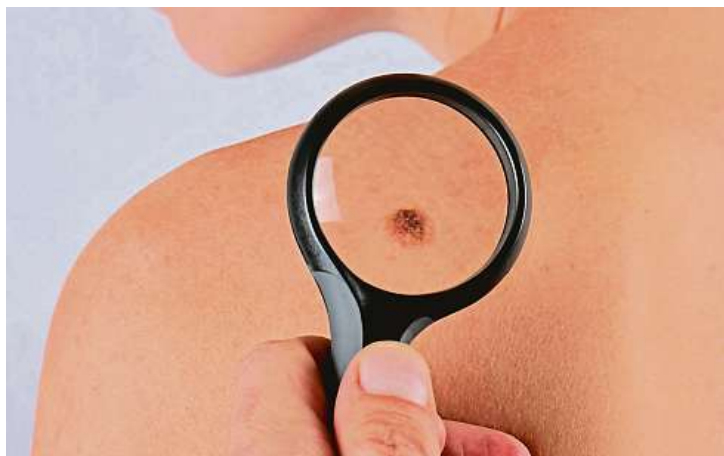
Některá znaménka mohou být nebezpečná.